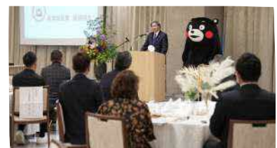
表彰式後に挨拶をする蒲島知事