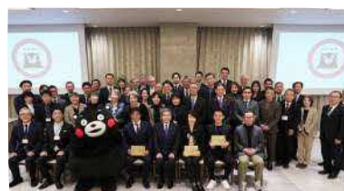
参加者の集合写真